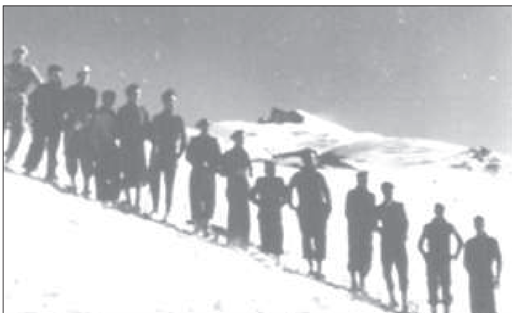
Filmación de un reportaje para NO-DO: el Frente de Juventudes en Sierra Nevada (Ministerio de Cultura, A.G.A., F/2031-14).

Hay que mencionar en este grupo las actividades de invierno de Falange en el albergue «Capitán Fernández» en Sierra Nevada (núm. 3, 1943), la visita del ministro de Gobernación a Guadix en el otoño de 1944 para inaugurar un grupo de edificaciones en la barriada de la Ermita Nueva (103 A), la del ministro de Obras Públicas en 1959 para comprobar el estado de los pantanos (840 A), y las del ministro de Información y Turismo Manuel Fraga en 1966 para celebrar oficialmente el estreno del Complejo Turístico «Sol y Nieve» y poco después del Parador Nacional de Sierra Nevada, en este caso también con la asistencia del ministro homólogo de Turquía (1.206 B y 1.250 B).