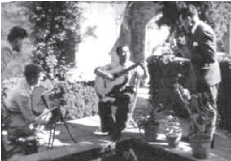
Rodaje de una secuencia en un carmen de Granada para la edición núm. 12 (año 1943) del Noticiero NO-DO (Ministerio de Cultura, A.G.A., F/2031-14).

Curiosamente no hemos localizado noticia alguna sobre festejos y festivales taurinos, a los que tanta cobertura informativa dedicó NO-DO en otros lugares, como por ejemplo en Málaga.