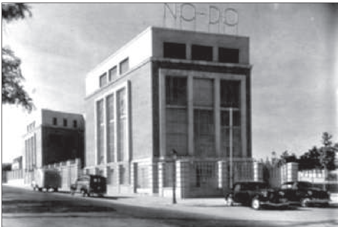
Edificio de NO-DO en la calle Joaquín Costa de Madrid (Ministerio de Cultura, Archivo General de la Administración –A.G.A. –, Cultura, F/2031-13).

Valencia y Baleares. Salvo en el caso de Barcelona, el Organismo rechazó la posibilidad de crear otras delegaciones estables a lo largo del país y sólo mantuvo una limitada red de corresponsales o colaboradores que no respondían a ninguna planificación de distribución geográfica y que tampoco mantenían relación contractual alguna con la entidad. A lo sumo disponían de un carnet expedido por NO-DO que les permitía grabar reportajes para esta casa, por lo general de poca relevancia, ya que cuando las noticias tenían especial importancia y se podían llevar a cabo los preparativos con el tiempo suficiente, la entidad desplazó a sus propios equipos. A finales de los años cincuenta se contaba con operadores en Canarias, Mallorca, Vigo, San Sebastián, Zamora y Valencia. En el momento de mayor expansión del Organismo y también cuando la red era más amplia, en 1968, había corresponsales en Canarias, Mallorca, Coruña, Lugo, San Sebastián, Zamora, Alicante, Valencia, Sevilla y Málaga 6 . Varias circunstancias, entre ellas la ausencia de realizadores o de redactores en el lugar donde se grababan las noticias, así como las limitaciones de tiempo y de material, hicieron que los operadores tuvieran un destacado protagonismo a la hora de cubrir la información, ya que debían escoger los momentos más relevantes, determinar qué tipos de planos había que tomar y la duración de los mismos, y en definitiva aprovechar los recursos.