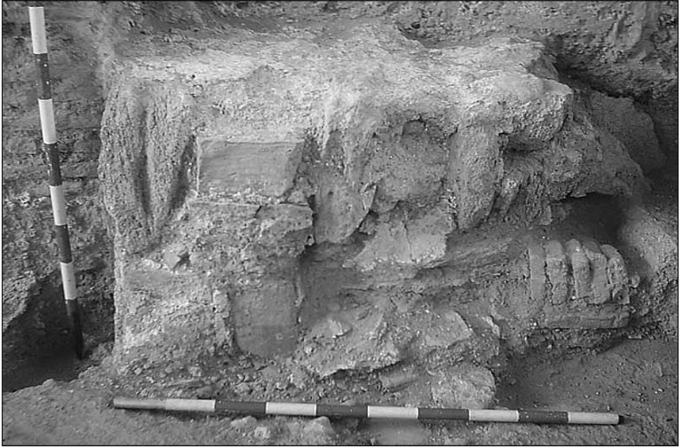
Restos de la jamba E (s. XI) del torreón SE de la Alcazaba de Guadix.

muy probablemente del siglo XI, por su técnica constructiva a soga y tizón (fig. 3). Esto confirmaba que la torre nazarí se encontraba forrando una puerta anterior de unas dimensiones más reducidas, presente al menos desde época de taifas.