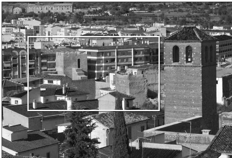
Situación del Torreón del Ferro y del paño de muralla de San Miguel hacia otra torre.

llegan las primeras referencias de una ciudad, ya de gran importancia estratégica y económica dentro del reino zirí granadino. De hecho, aparece como una “hija de Granada” ( bint Garnāta ) 36 y como uno de los principales núcleos de aporte de riqueza al Estado. Recordemos el texto que citamos supra de las Memorias , en el que se nos habla de la alcazaba de Guadix como un lugar de difícil asedio y conquista. De este periodo, por ejemplo es la torre-puerta situada en el SE de la que hablaremos más abajo.