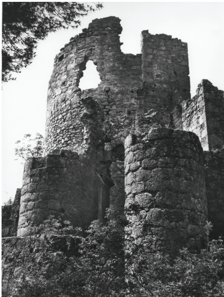
Lám. 21. La Adrada (Ávila): puerta de entrada al castillo en 1967.

ademas parece que esta un poco mal cuidado y no lo tienen enfocado como atracción turística si no como un lugar para realizar eventos. Curioso de ver pero un poco decepcionante el interior, como curiosidad en el se grabaron varios capítulos de la serie de águila roja." 70 [en junio de 2016]