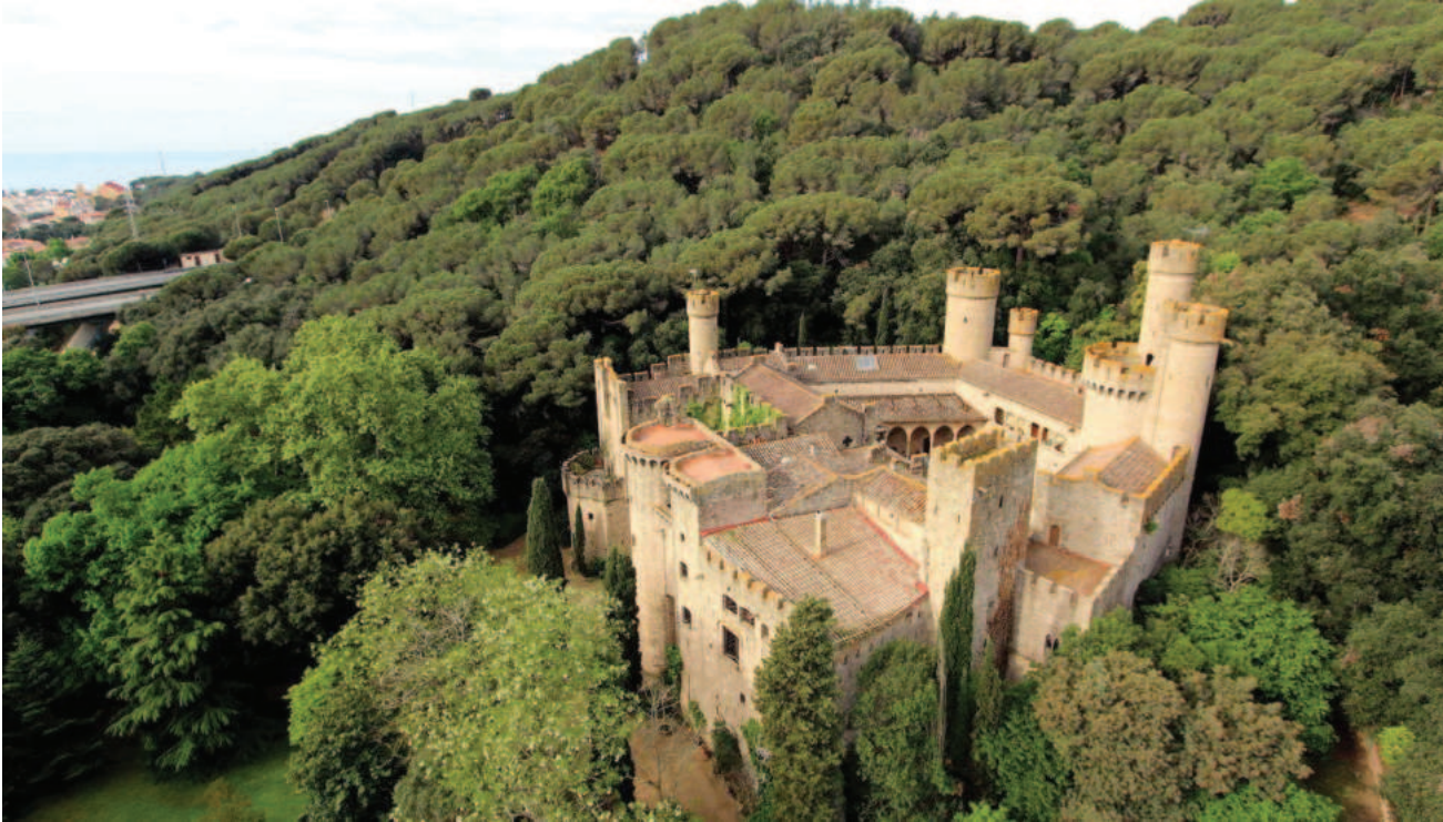
Lám. 6. Castillo de Santa Florentina, Canet de Mar (Maresme). El único resto auténticamente medieval son los dos cubos amatacanados.