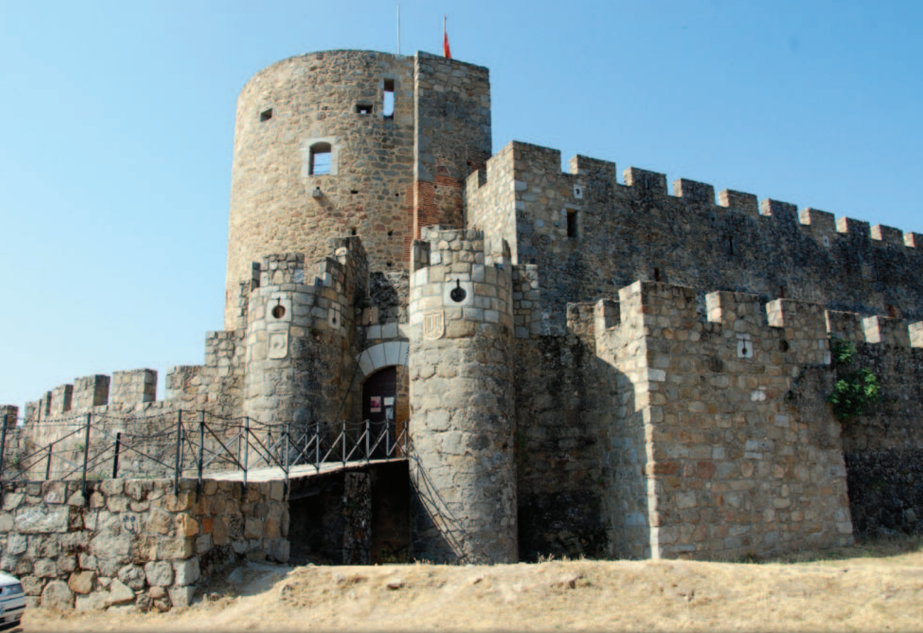
Lám. 22. La Adrada (Ávila): puerta de entrada del castillo post-2002. Los escudos, de reciente confección, son falsos.

“Mucho me temo que Castilla pierde hoy otro símbolo. El problema de reconstruir no es darle un uso actual, como quieren hacernos tragar, por ejemplo, hostelero, turístico, cultural, etc.; el problema es que eso requiere por parte del arquitecto de hoy el conocimiento de los oficios del ayer y la humildad suficiente para adaptarse y respetar al constructor/arquitecto/maestro original... y eso escasea. Es también respeto a la sociedad de la época que lo vio nacer y a nuestra historia como pueblo, sobre la que se puede y debe edificar nuestro futuro. Y eso también escasea. ¿Se han dado cuenta lo mucho que los arquitectos de hoy repiten la palabra 'sostenibilidad', sin pararse a pensar que lo que de verdad se debe decir es 'perdurabilidad', al tiempo que emplean materiales y técnicas no precisamente perdurables medioambientalmente debido al altísimo gasto de energía requerido en su fabricación y transporte? Estoy de arquitectos divos, en realidad una panda de mindundis, de mediocres repite estupideces que ni les cuento.” 71