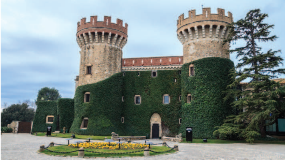
Lám. 4. Castillo de Peralada (Baix Empordá). El mazapán ha sido sustituido por la hiedra.