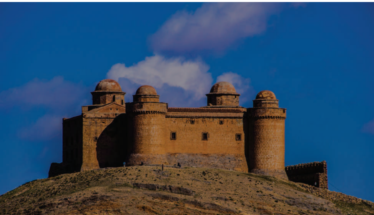
Lám. 25. Castillo de La Calahorra (Granada).