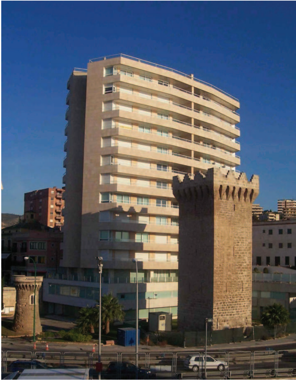
Lám. 19. Palma de Mallorca: torre de Paraires, ¡protegida ya!