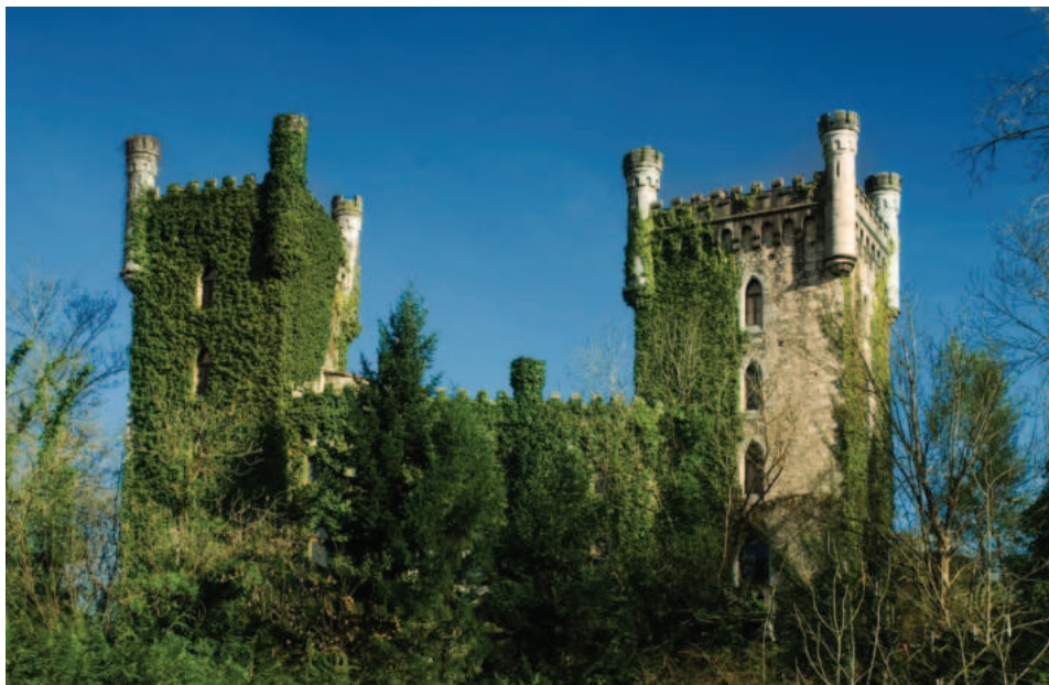
Lám. 13. Castillo de Priorio (Las Caldas, Asturias).

samente el vano dejado por el derribo de un lienzo antiguo. El edificio tiene la planta de muchísimas casas solariegas en el norte de España construidas en el periodo Habsburgo, dos torreones, en este caso agaritados, unidos por una crujía: