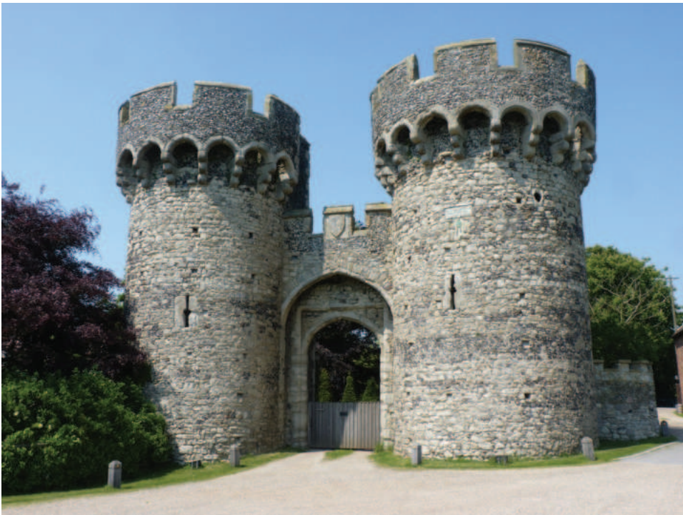
Lám. 5. Cooling Castle (Kent).