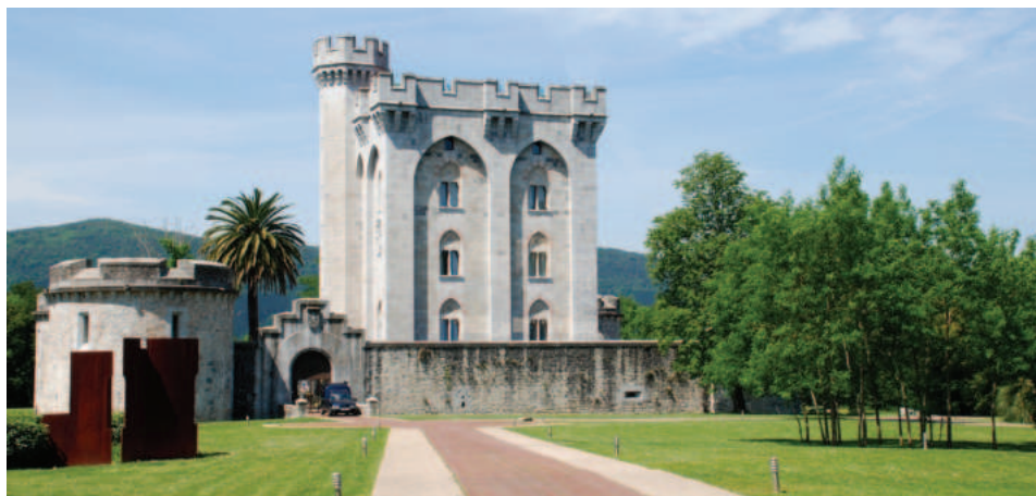
Lám. 9. Castillo de Arteaga.