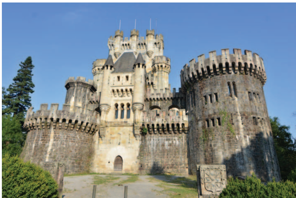
Lám. 8. Castillo de Butrón (Gatica, Vizcaya).

defensivos en los ángulos, como los ejemplares de Muñatones o Mendoza (Álava) 29 . En el caso de Butrón, los cubos han sido agrandados descomunadamente, añadiendo agobio al caos visual. Los alzados ofrecen el aspecto de un léxico sobrecargado de todos los elementos de arquitectura defensiva que hay, como la profusión de saeteras cruciformes (prácticamente insólitas en la España medieval). Domina el conjunto una copia (más o menos) de la torre del homenaje del alcázar de Segovia –como han comentado otros autores– sobre un desordenado despliegue de cuerpos “agaritados”, en una aproximación al estilo de Viollet-le-Duc. Los vanos mezclan ajimeces románicos con triforas de estilo valenciano del siglo XIV. Del lado nordeste de la torre del homenaje sobresale disparatadamente el ábside de la capilla, obligando la