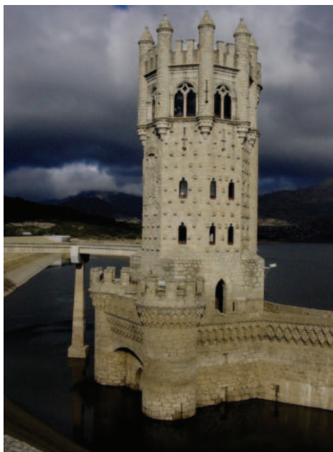
Lám. 2. Torre inundada por la nueva presa.