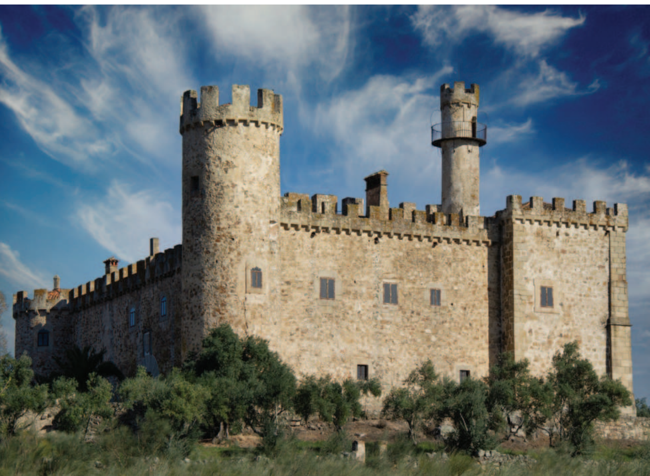
Lám. 16. Castillo de las Arguijuelas de Arriba (Cáceres).

Se realizaron en estas épocas otros arreglos anacrónicos de castillos como, por ejemplo, los extremeños de Arguijuelas de Arriba (sierra de Montánchez), Piedrabuena en el término de Albuquerque (Tierra de Badajoz) y las Seguras (Llanos de Cáceres). La reforma de todos ellos, dedicados a residencia personal, es de un estilo y proceder uniforme. El primero fue heredado por el marqués del Reino, García de Arce y Aponte, un notable bohemio, fallecido en 1897. Tenía, como otros de su casta, intereses científicos, habiéndose acreditado una de las primeras instalaciones de pararrayos en Extremadura (Ramos & San Macario, 2013: 281-282). Su biografía es un popurrí de anécdotas, muchas inventadas por él, a base de lo cual hay que adivinar que su indiscutiblemente inmensa cartera de inmuebles heredados, tal vez no muy renta-