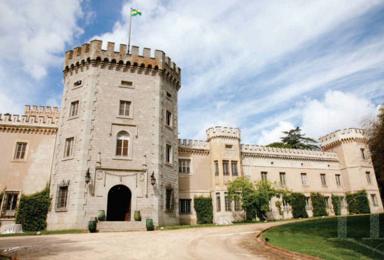
Lám. 17. Palacio del Rincón (Aldea del Fresno, Madrid).

Maximiliana. Después de la instalación del régimen juarista en 1857 Escandón se exilió a Francia 50 . El duque de Montellano, su yerno, fue sobrino del barón de Benifayó, lo cual quiere decir que el parentesco entre los constructores de estos tres pseudo-castillos parece haber dado lugar a un diluido gusto neogótico.