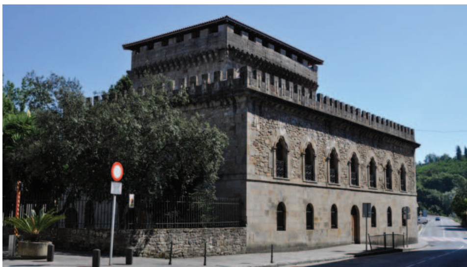
Lám. 15. Torre de Villela. El torreón núcleo del conjunto parece ser del siglo XV, de la misma estirpe que la algo menos transformada torre Luzea, de Zarauz (Guipúzcoa). Heredó la de Villela la condesa de Lences, quien lo reformó drásticamente en 1852. El torreón perdió entonces sobre todo su eje arquitectónico. El dinero para la operación era lógicamente de su marido, el marqués del Duero, un indiano nacido en Méjico en 1808. Maite Paliza (1992: 63) facilita los datos de forma algo confusa. Su dominio en materia de castillos no es del todo fiable, pues llama "saetera" lo que es un buzón (Paliza, 1992: 74), y es otro desliz el que no sabe deletrear mi nombre.