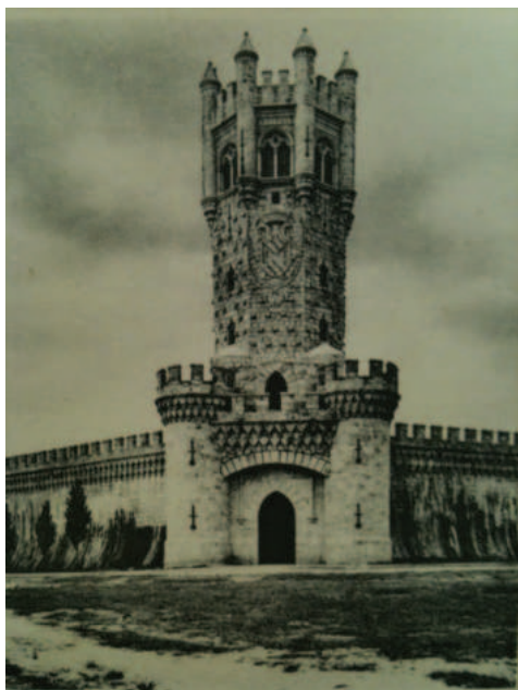
Lám. 1. El capricho del embalse de Santillana. Torre de la antigua presa.