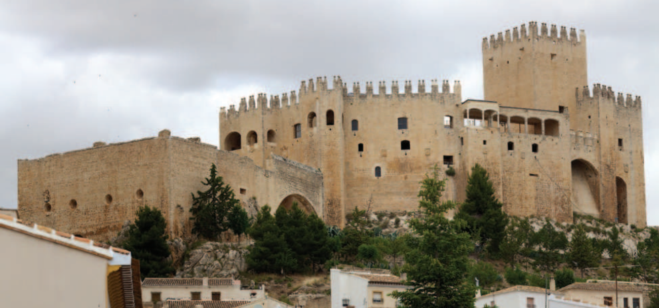
Lám. 24. Castillo de Vélez Blanco (Almería).

Es evidente de la epigrafía que el castillo de Vélez Blanco es cronológicamente la primera de las tres fortalezas marquesales. Pero una anomalía importante es que lleva las armas de Catalina de Silva, quien no entró en el escenario hasta, teóricamente, cuando se hubo terminado la obra. Ninguno de los escudos va timbrado con la corona del marquesado. No faltaban actos de caridad en la expiación del marqués. Cuando la ciudad de Vera (levante almeriense) fue arrasada por el terremoto de 1518, los primeros auxilios llegaron del marquesado. Es lícito especular que el marqués apoyaba el intento de fundar en 1523 un studium de humanidades en la ciudad de Murcia. Consciente sin duda de la necesidad del abastecimiento de agua hizo construir en el centro de Vélez Blanco la Fuente de los Cinco Caños. Era notablemente constante en sus amistades, por ejemplo con el marqués del Cenete 77 , creador del castillo de La Calahorra, y con su sucesor en el título, Enrique de Nassau.