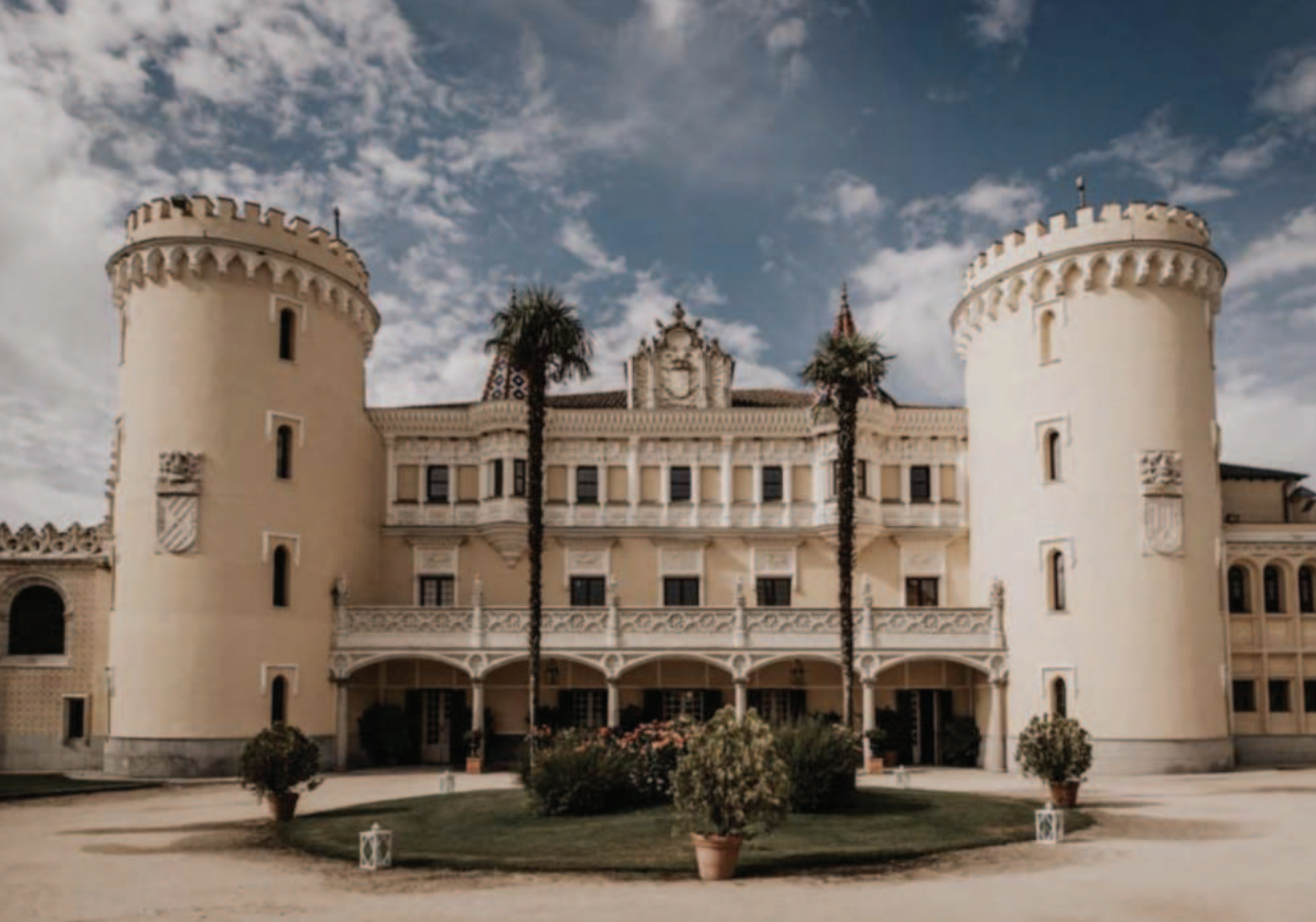
Lám. 3. Castillo de Viñuelas (Cuenca Alta del Manzanares). El paño central debe algo al palacio del Infantado en Guadalajara, y el pretil de los cubos parece ser derivado del palacio Real de Sintra (Portugal). Todo en mazapán rosa.

Lampérez murió en 1923, y en 1927 el duque compró el castillo de Requesens (Gerona) en la sierra pirenaica de l'Albera, aún más aislado del mundo habitado que el de La Calahorra. Hubo de ser el duque quien construyó tres kilómetros de cañerías para proporcionar agua corriente al castillo 12 . También le procuró el suministro de electricidad generada en una esclusa propia 13 . Consiguió mantener la posesión sólo quince años. El motivo de la adquisición es un misterio. Requesens no es ninguna Calahorra. Su valor defensivo fue muy modesto, y desde finales del siglo XIII carecía realmente de importancia. Es decir, historia prácticamente no tenía.