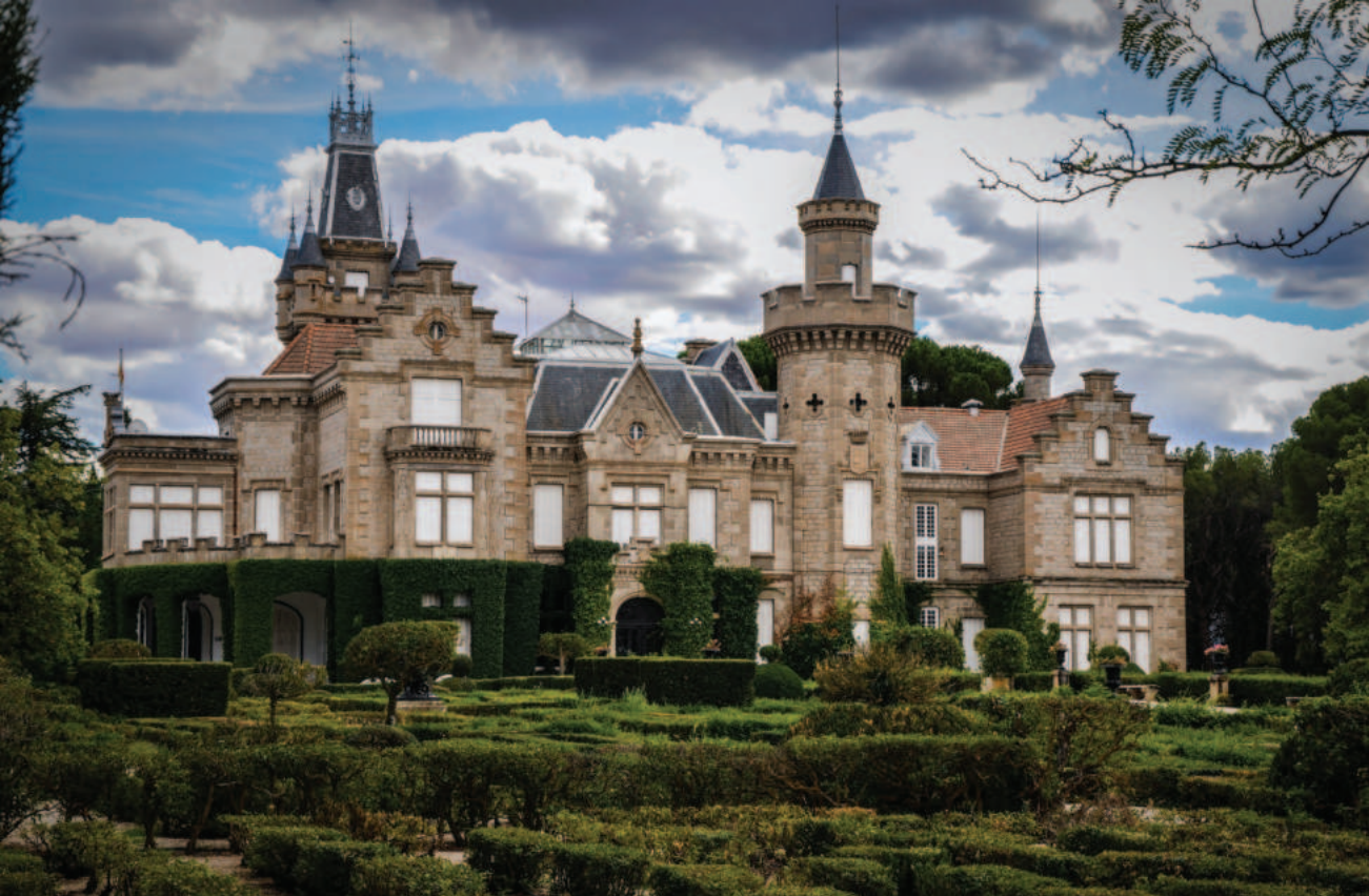
Lám. 18. El Castañar (Mazarambroz, Toledo).