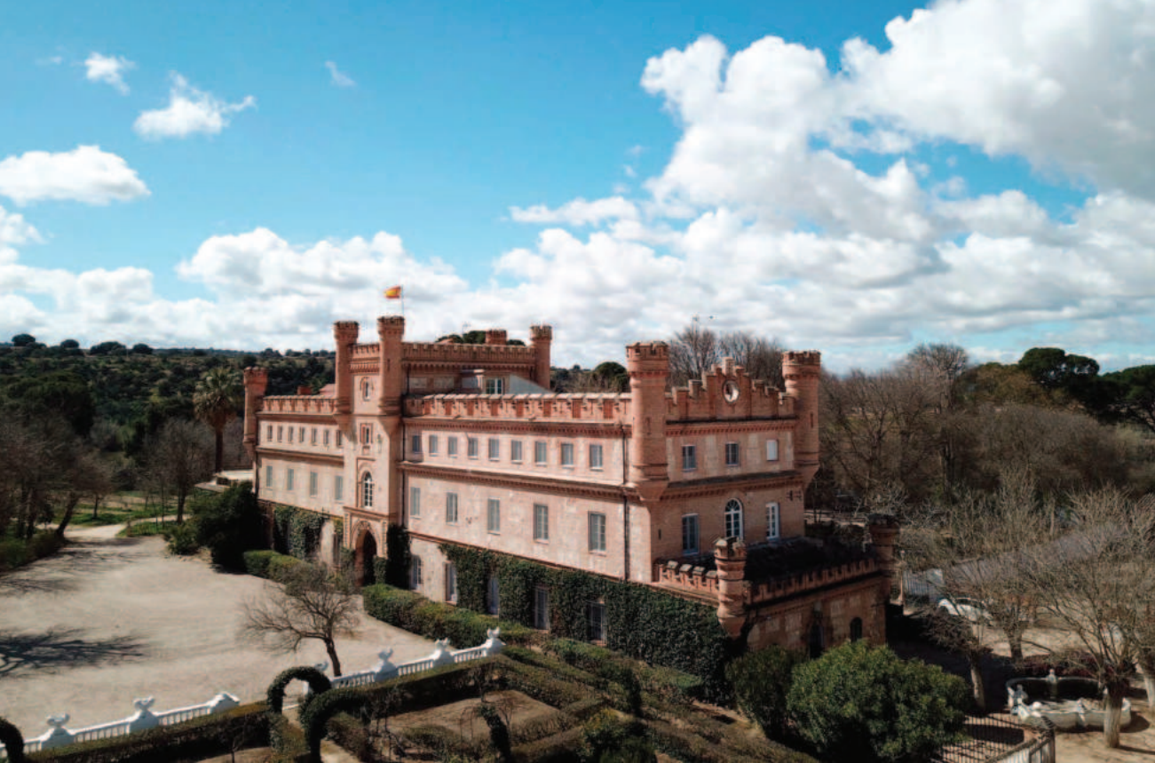
Lám. 12. La Ventosilla (Vegas del Tajo, Toledo).

histórico condado de Teba. La madre de esta condesa era sobrina del mismo barón de Benifayó. El de Santoña, por lo tanto, oriundo de una humilde familia –tachado además por un ruidoso y vengativo pleito de parientes poco honrados– había ascendido, como la progenie del marqués de Mudela, a los más altos rangos de la nobleza 45 . Si no fuera porque el número de módulos a cada lado de la portada del palacio de Ventosilla no es igual la fachada sería rigurosamente simétrica. Carece exteriormente de motivos visiblemente neogóticos. No se atreve a llamarse castillo pero, por otra parte, tiene garitas, almenas y torre del homenaje. Así, por los criterios de la legislación de los Reyes Católicos, sí tiene cabi-