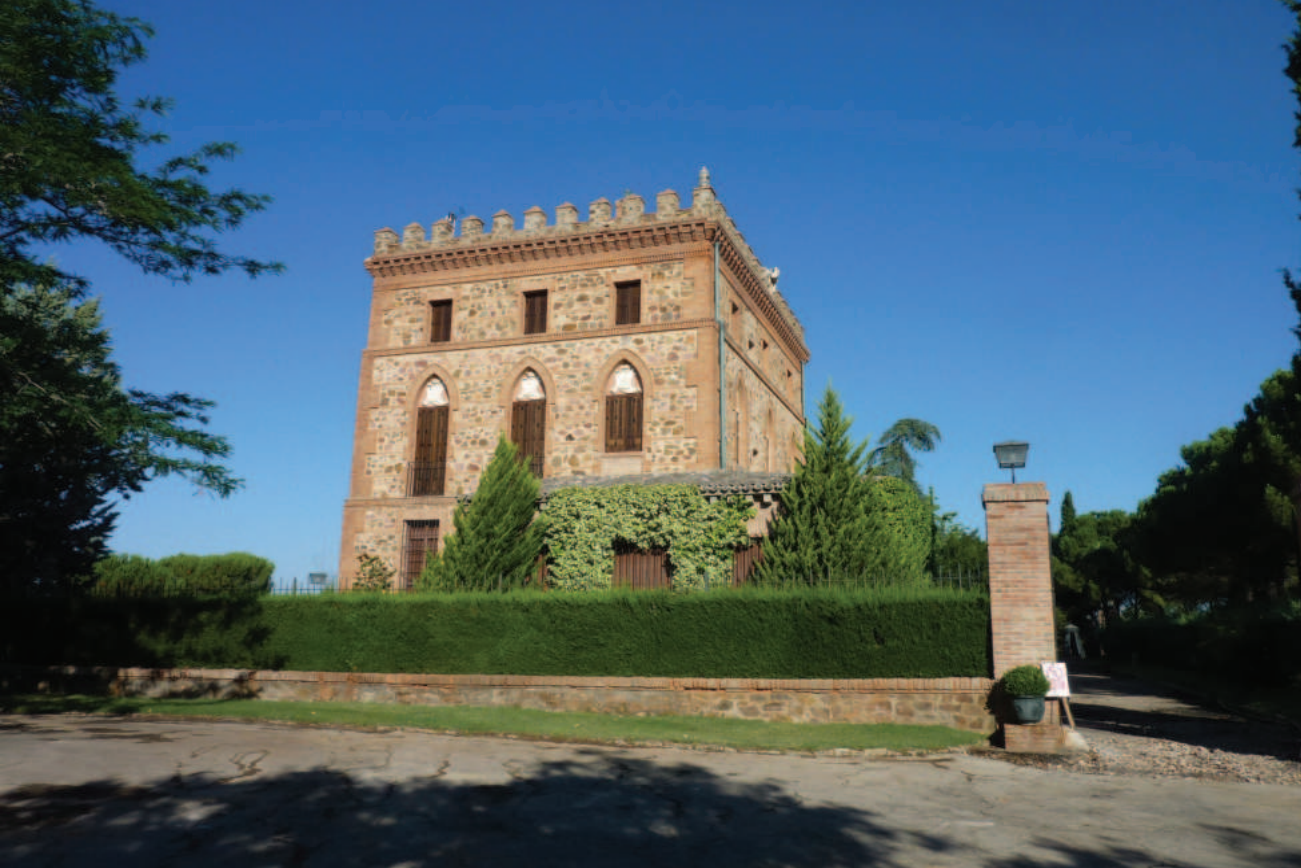
Lám. 11. Castillo de Mudela (Villalba de Calatrava, Ciudad Real). Pese a lo que dicen los medios informativos, no tiene ninguna base medieval.

arranque especulativo radicado en el despegue económico de la capital, este marqués llegó a ser exportador de hierro con naviera propia, y vitivinicultor a gran escala gracias a una extensión enorme de viñedos centrada en el Campo de Calatrava, cuya ciudadela es el castillo de Mudela (Ciudad Real) (Otero & Bahamonde, 1989: 1. 523-594). Cabe suponer que el arquitecto fue Lorenzo Álvarez Capra, autor del palacio del marqués de Mudela en Madrid. Lo que hace verosímil esta identificación es el parecido estilístico con el palacio del barón de Benifayó en San Pedro del Pinatar (Mar Menor), conocida obra de Lorenzo Álvarez, construida en 1892.