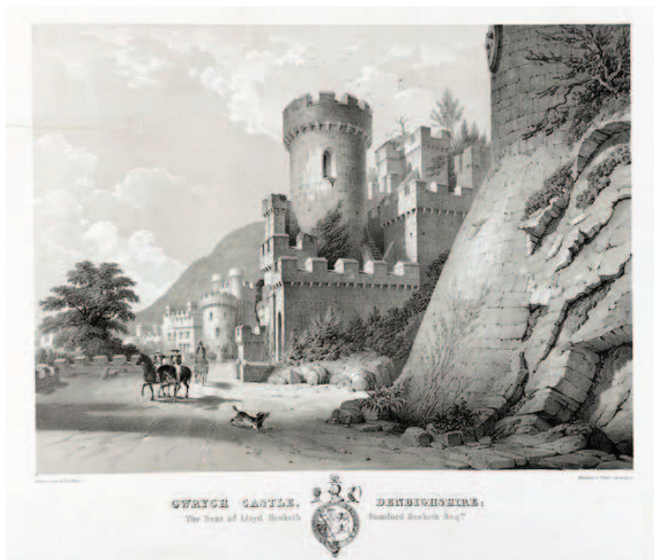
Lám. 7. Castillo de Gwrych (Gwynedd, Gales), según W.K. Walton (c. 1840). National Library of Wales, Aberystwyth.

do en el siglo XIV por falta de sucesión masculina 22 . Si no fuera la intención de Santa Florentina eclipsar medio siglo después el santuario, no cabe duda de que lo consiguió. Incluso la Mare de Deu fue derruido por elementos republicanos en la Guerra Civil. Puede ser una pura coincidencia el que un nieto de Ramón Montaner fuera procesado en 1940 por comunista y francmasón. Santa Florentina, un símbolo del antiguo régimen, más aún que el santuario, quedó inerme.