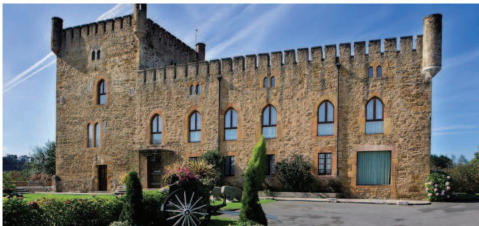
Lám. 14. Torre de los Valdés (San Cucao de Llanera, Asturias): garitas, almenas, torreón. El apellido Valdés abunda en Cuba en el siglo XIX (un Ramón Valdés era el brazo derecho del marqués de Comillas en Matanzas), pero no consta conexión específica con esta torre.