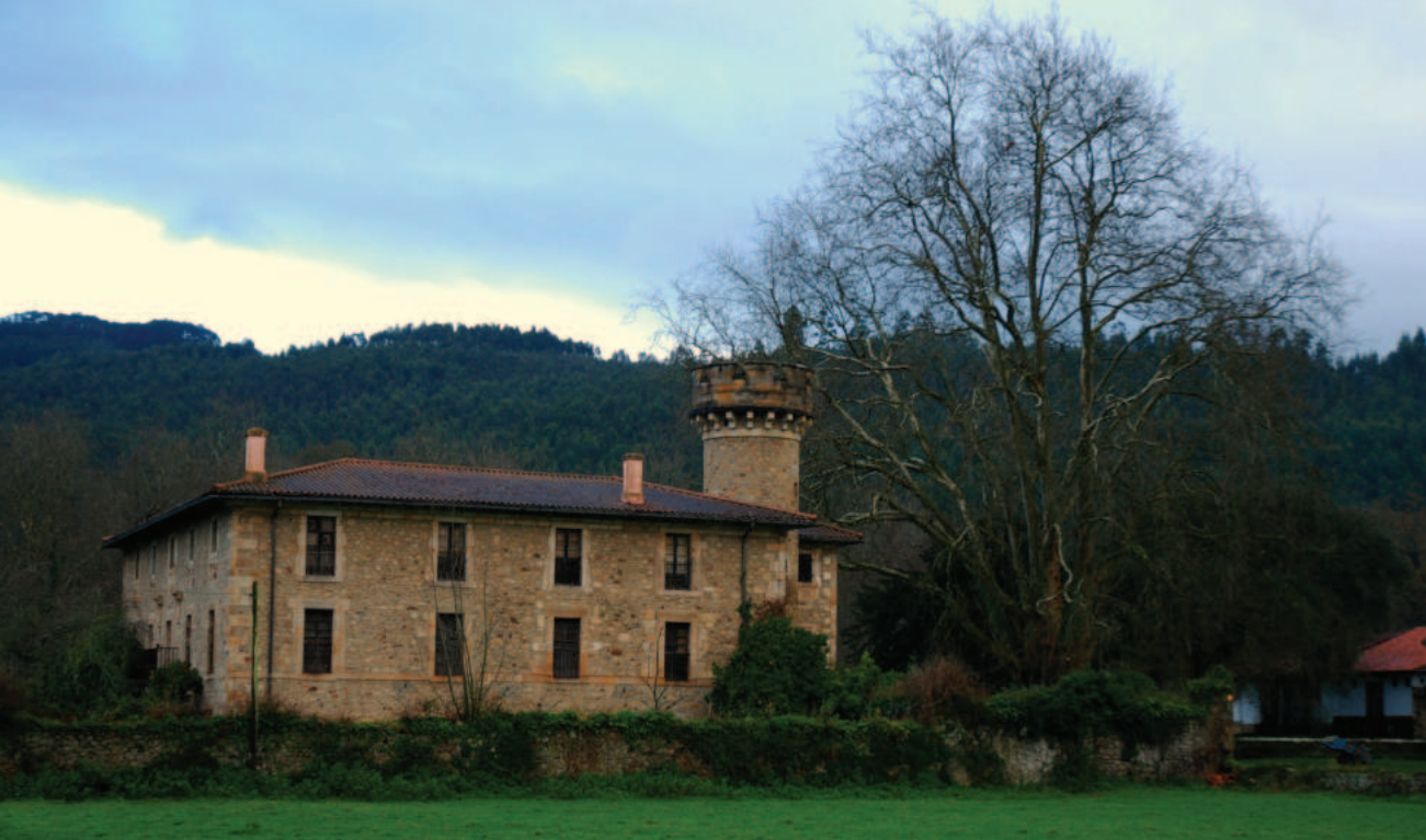
Lám. 10. Ferrería de la Yseca (Gurriezo, Cantabria).

La planta primitiva del castillo de Arteaga fue igual que el torreón y barrera de Butrón 34 , y ha determinado el formato de su recreación. Una opinión bastante difundida asevera que la "reconstrucción estuvo muy influida por el criterio restauracionista de Eugène Viollet-le-Duc, de recuperación de la imagen inicial" 35 . Se conserva buena parte de la barbacana, que se distingue por su aparejo de mampostería, algo disfrazada por los posteriores arreglos. El torreón es enteramente nuevo, obra fundamentalmente de hacia 1860 del arquitecto francés Gabriel-Auguste Ancelet, cuya esposa, Isabelle Foucher, fue hija de Paul Foucher, cuñado de Victor Hugo.