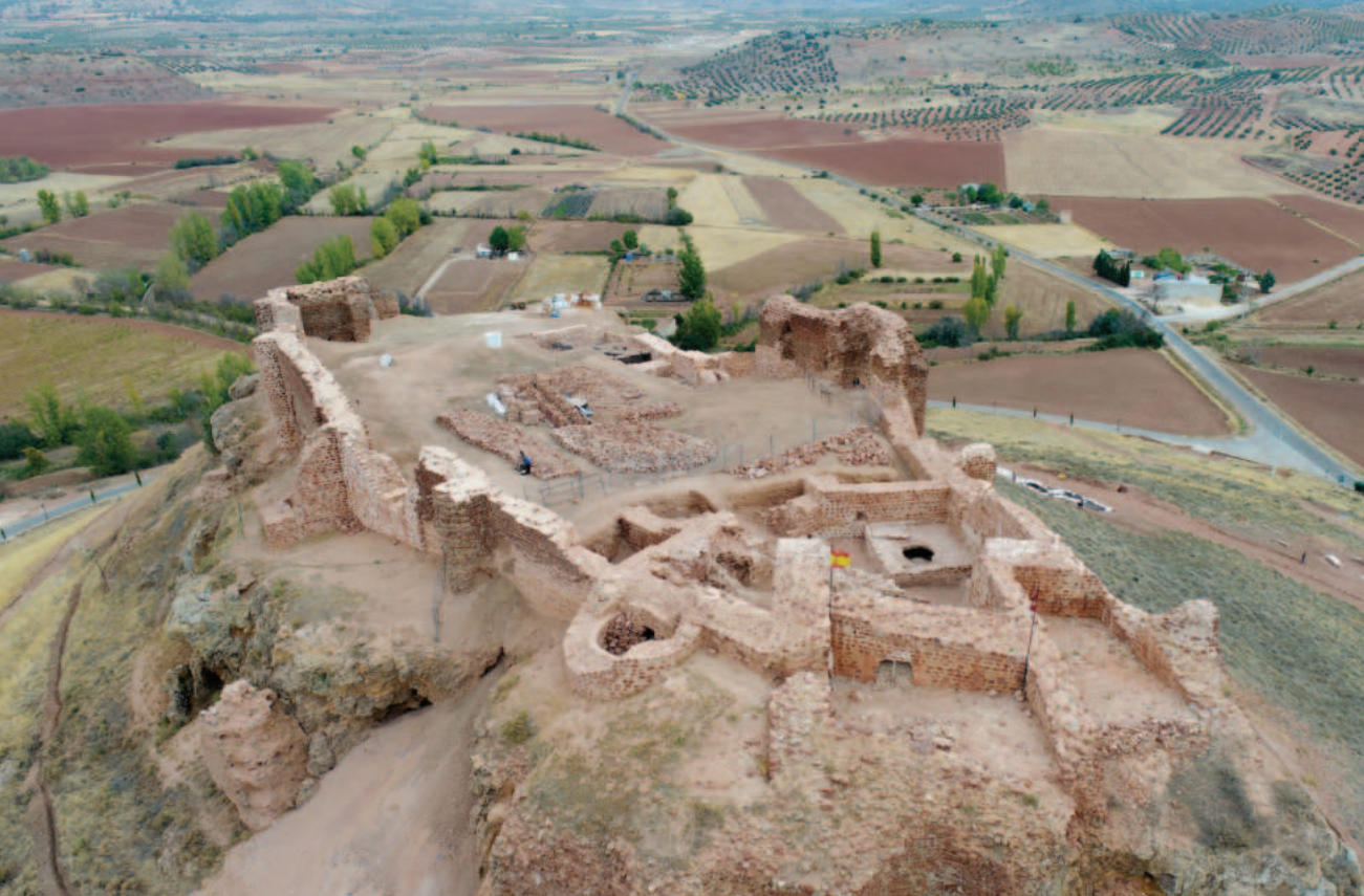
Lám. 13. Castillo de la Estrella (Montiel, Ciudad Real). Real.

Su castillo fue adquirido por un grupo de amigos que lo donaron al Ayuntamiento a comienzos de 2012. Crearon una fundación local, que con la colaboración de asociaciones locales, el Ayuntamiento de Montiel, la Universidad y la Junta de Castilla-La Mancha, excavan y restauran el castillo y organizan diferentes actividades con la población para potenciar el conocimiento histórico del castillo y de la Edad Media en el Campo de Montiel, dirigidas la mayoría de ellas por los codirectores del conjunto arqueológico del castillo. También hacen jornadas técnicas sobre la historia de la construcción medieval, talleres de empleo, certámenes de pintura.