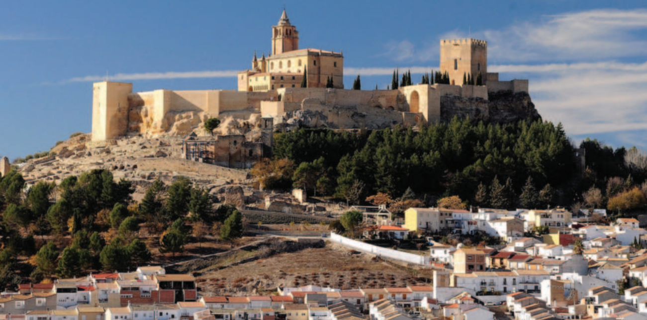
Lám. 18. Fortaleza de la Mota (Alcalá la Real, Jaén). Premio Hispania Nostra 2017 en la categoría de conservación del patrimonio como factor de desarrollo económico y social.

Recordemos también, como pequeño consejo y recomendación, que el mejor método de protección es el que proporcionan los propietarios, no los legales, sino los emocionales, que normalmente es la población local, quien por cercanía es su mejor protección. Razón por la cual es fundamental implicarla y hacerla partícipe de los esfuerzos que las Administraciones hacemos para mejorar los entornos, para reforzar en ellos el sentimiento de identidad hacia el bien; porque cuando se conoce lo que se ve, se empatiza con el entorno; lo que se comprende, se quiere; lo que se quiere, se protege; y lo que se considera propio, se defiende. Y además, "conocer, comprender y querer, es la base más firme para proteger".