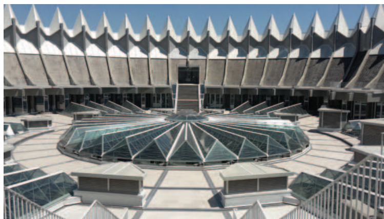
Lám. 1. Cubierta del Instituto del Patrimonio Cultural de España (Madrid).

Como el edificio es redondo y tiene pinchos en su coronación se le conoce como: "la corona de espinas", obra de los arquitectos Fernando Higueras y Antonio Miró. No hay que confundir con el Tribunal Constitucional que también es redondo, está en Madrid, pero tiene otra función bien distinta.