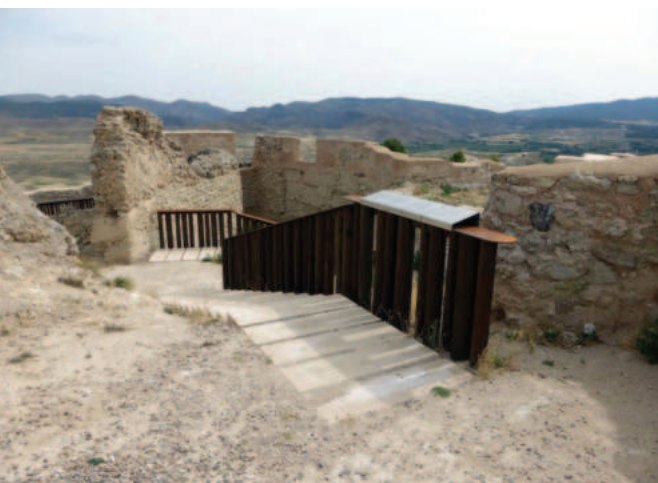
Lám. 16. Consolidación y restauración del sector sur del castillo Mayor de Calatayud (Zaragoza), impulsados por el IPCE entre 2013 y 2015. Se trataba de una zona con fábricas muy deterioradas, que fueron consolidadas y recuperados los paños derruidos del lienzo sur hasta la altura de protección de un metro, sin formar líneas rectas, mostrando siempre su carácter de ruina y garantizando la seguridad de los visitantes. Finalmente, se instalaron rampas y escaleras con barandillas, así como paneles didácticos.

Recordemos siempre que el ciudadano sabe lo que quiere, lo que nos puede pedir y aquellos que nos va a exigir. Todo lo cual debemos tener en cuenta durante el proceso de recuperación, pues la sociedad vigila no sólo lo que hemos hecho con el dinero de sus impuestos, sino cómo lo cuidamos después. Desde un principio, cuando programamos, cuando redactamos los pliegos de contratación, cuando estudiamos posibles usos, cuando proyectamos, cuando realizamos lo proyectado, cuando inauguramos, pero también después.