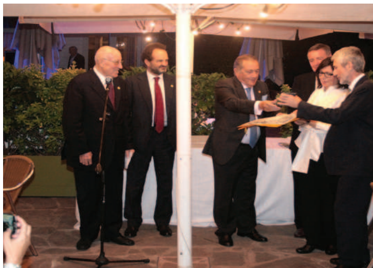
Lám. 5. Entrega de la medalla de oro (2017) de la Asociación Española de Amigos de los Castillos al Plan Nacional de Arquitectura Defensiva, promovido y coordinado por el IPCE.

Desde el primer inventario de 1968, realizado por la Dirección General de Bellas Artes bajo las recomendaciones del Consejo de Europa, son varias las tipologías, algunas fáciles de identifi-