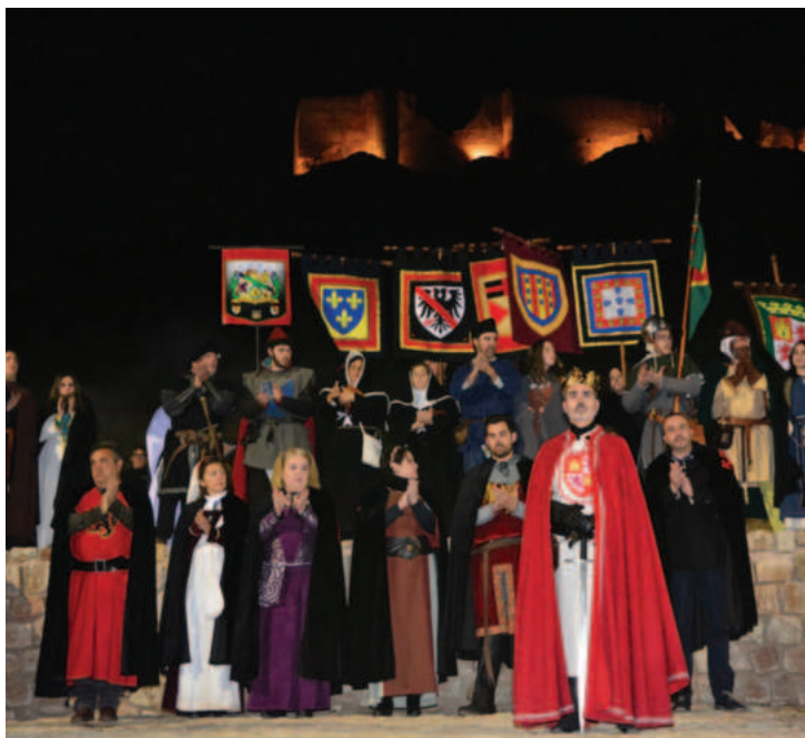
Lám. 14. Montiel Medieval 2019. Recreación de la llegada de Pedro I a Montiel.

Madrid, Mimaia en Castilla la Mancha, Estudio Atope en Andalucía o Arae en la Comunidad Valenciana.