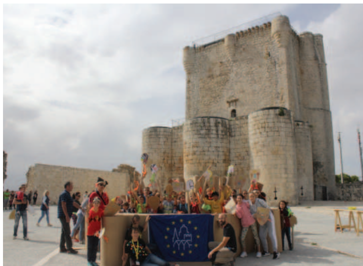
Lám. 15. Actividad didáctica del proyecto «HA del castillo!!», realizada en 2019 por Arae Patrimonio Restauración en el castillo de Íscar (Valladolid).

un refrigerio, con aseos y donde comprar un recuerdo, cuya presencia no reste protagonismo al bien al que da servicio y aporte un beneficio económico a la localidad. Cuanto más discretos y miméticos sean con el paisaje mejor. Algo muy difícil debe ser, cuando es lo contrario de lo que sucede normalmente.