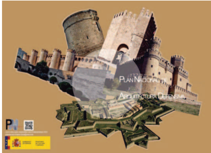
Lám.6. Folleto del Plan Nacional de Arquitectura Defensiva. Diseño: Sara Miguélez Díez.