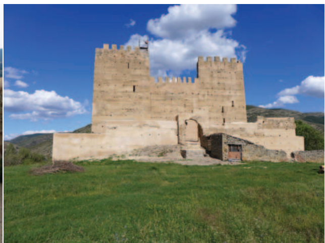
Lám. 17. Obras del proyecto de consolidación y restauración del lienzo norte del castillo de Yanguas (Soria), que el IPCE realiza en el marco del Plan Nacional de Arquitectura Defensiva (2022). El proyecto pretende consolidar los cimientos y reconstruir los restos de la muralla septentrional del recinto exterior, para proporcionar continuidad visual y constructiva y permitir el uso de los espacios de transición, mejorando la experiencia de los visitantes.