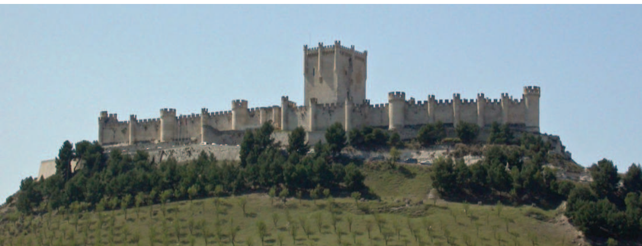
Lám. 4. Castillo de Peñafiel (Valladolid).

Tras un largo recorrido, el 14 de febrero de 2018, se firmó un convenio para poner en funcionamiento el SIG/PAM (Sistema de Información Georreferenciada para el Patrimonio Arquitectónico Monumental), diseñado por la comisión del PNAD y el IGME (Instituto Geológico y Minero de España), con el objetivo de tener los bienes defensivos georreferenciados mediante un novedoso sistema. Se pretende con ello ofrecer una herramienta común para estudiar a todos estos bienes mediante un criterio homogéneo, desde nuevos puntos de vista en relación con el territorio, analizándolos junto a caminos históricos, riesgos naturales, canteras históricas, etcétera; independientemente de la Comunidad