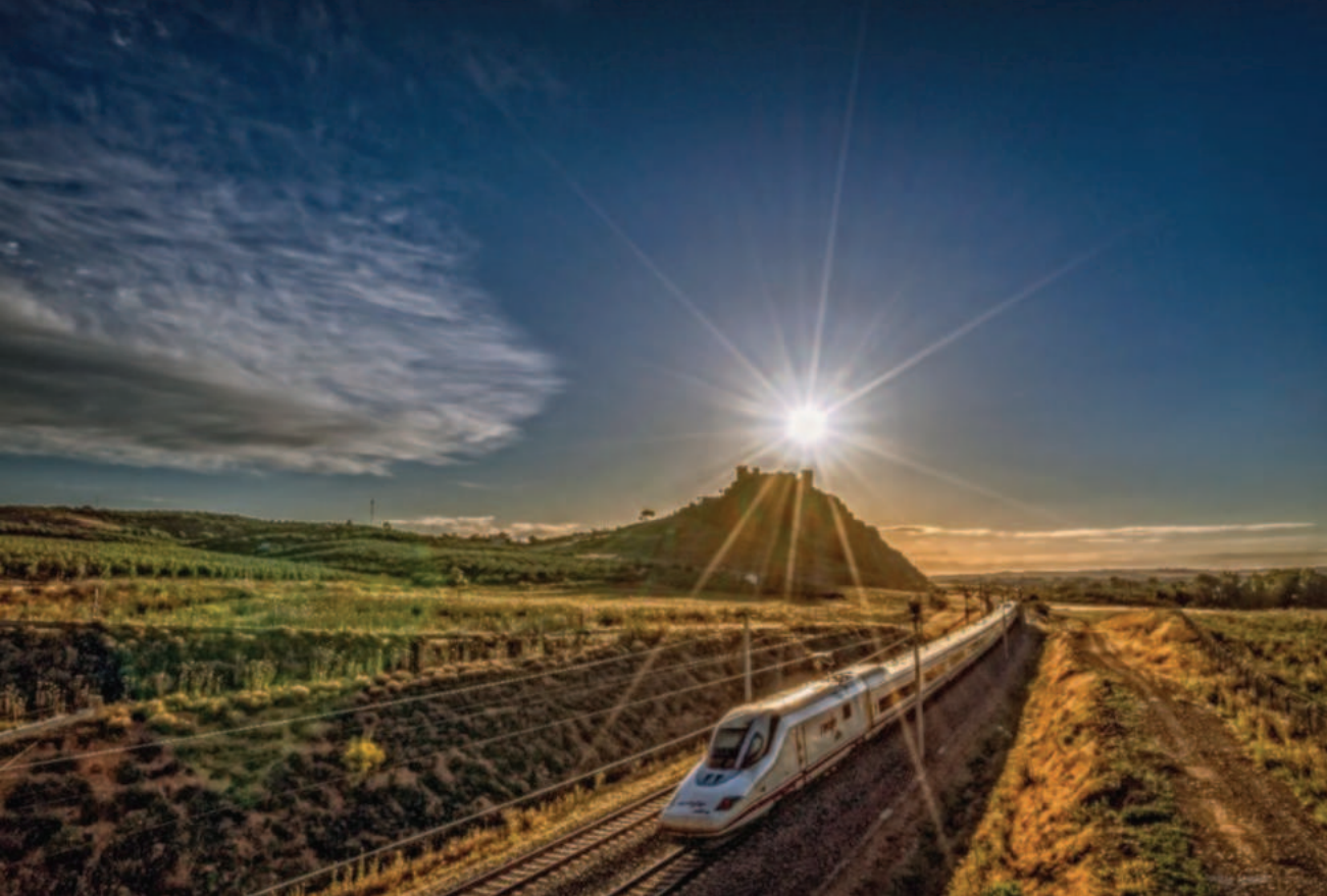
Lám. 1. Amanecer en el castillo de la Floresta (Almodóvar del Río, Córdoba).

Sin embargo, pese a la exigencia de protección que nos marca la Ley, no todos los bienes requieren ser protegidos con el mismo nivel, para lo cual la LPHE distingue tres niveles de protección: