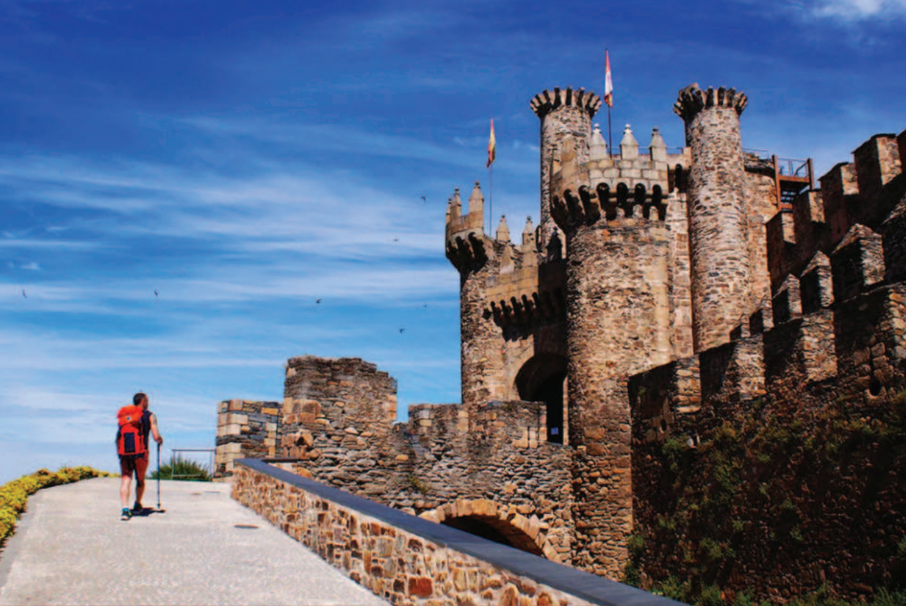
Lám. 9. Peregrino ante el castillo de los Templarios (Ponferrada, León).