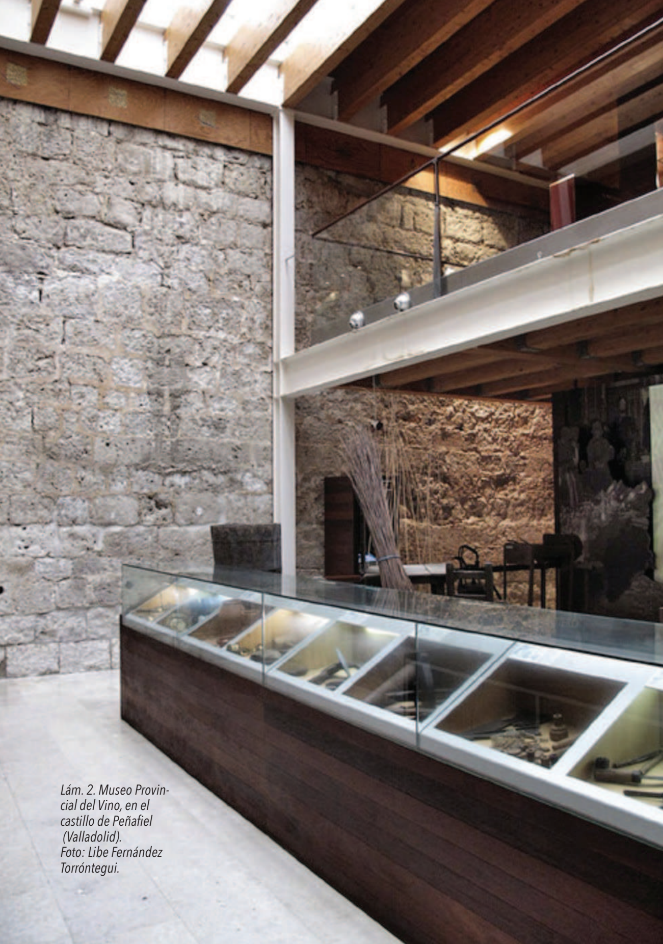
Lám. 2. Museo Provincial del Vino, en el castillo de Peñafiel (Valladolid).