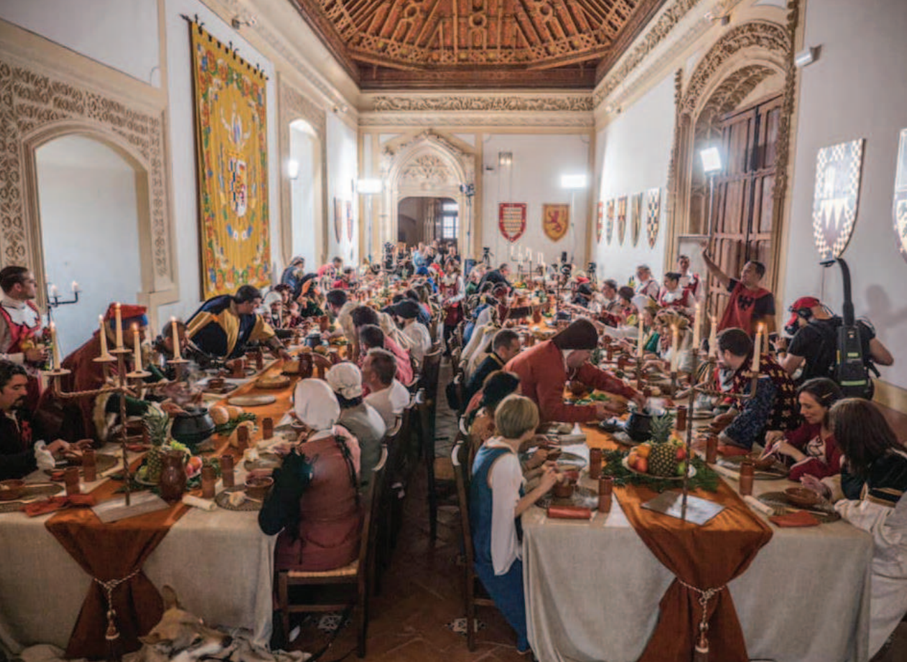
Lám. 5. Grabación del programa Máster Chef Celebrity (ed. 2019) de RTVE1, en el castillo de Belmonte (Cuenca).

De este modo, este club de producto pretende que el turista viaje a través de la historia de un determinado castillo o palacio, interpretándola y experimentando una serie de emociones, evocaciones y recuerdos a través de los cuales pueda ir adquiriendo un aprendizaje emocional y lúdico.