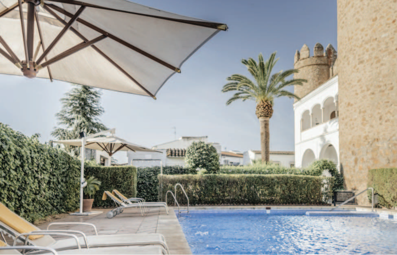
Lám. 6. Parador de Zafra (Badajoz), en el castillo de los Duques de Feria