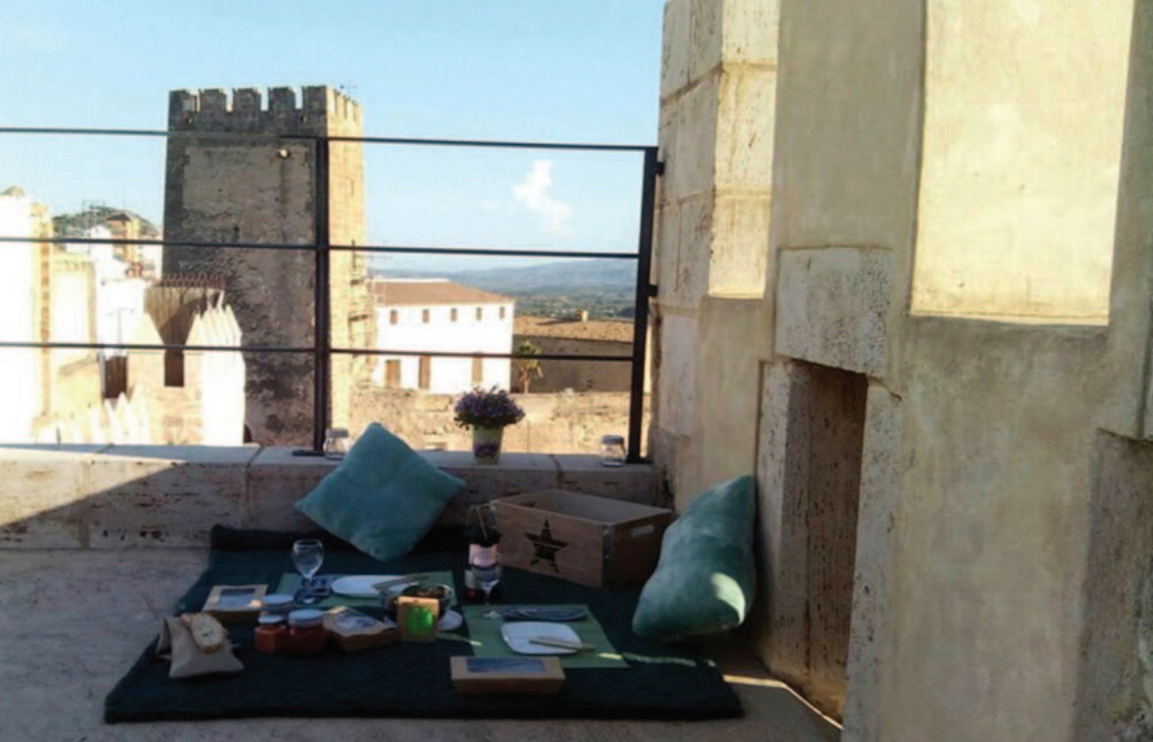
Lám. 7. Pícnic en las torres del castillo de Buñol.

Esta cifra se verá aumentada a partir de la puesta en marcha de la plataforma tecnológica Spain Heritage Network 2 , concebida como la herramienta de cohesión de la Red de Castillos y Palacios de España en una sola plataforma como canal on line para la distribución, el acceso del turista, la comunicación, márketing y visibilidad del producto. Así como la integración con otras redes para añadir servicios complementarios y permitir, de este modo, el desarrollo no sólo de visitas puntuales sino de rutas turísticas que distribuyan la demanda a lo largo de todo el año y por todo el territorio, en pro de su desestacionalización.