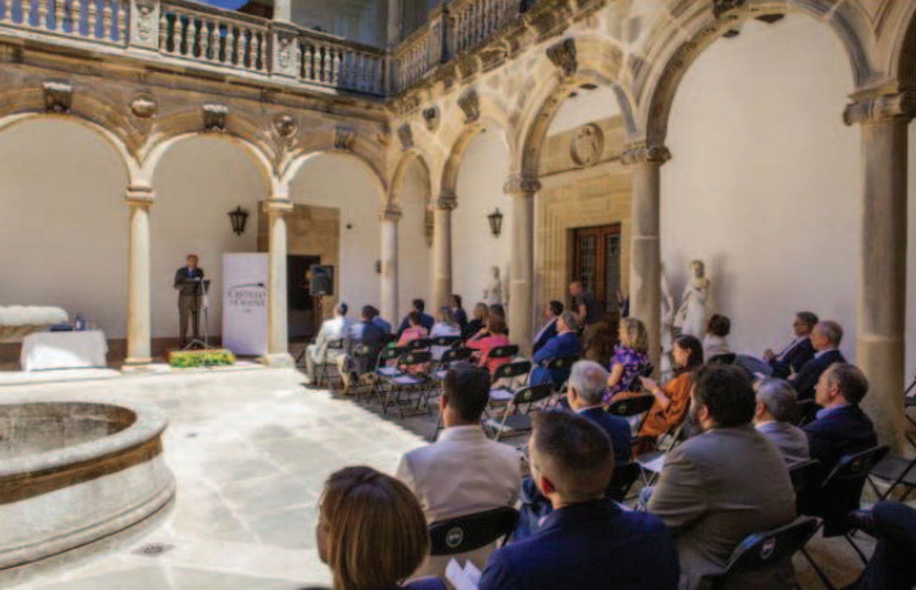
Lám. 8. Entrega del VI Premio de Investigación Oleícola 'Luis Vañó' (2022) en el castillo de Canena (Jaén).

Así pues, este producto de turismo cultural supone una alternativa a otros tipos de turismo ya manidos y anquilosados, desestacionalizando el sector y con importantes repercusiones sociales pues supone la puesta en valor de zonas despobladas a través de su patrimonio histórico, favorece su desarrollo económico y laboral, se complementa con otras propuestas como oleoturismo, enoturismo o gastroturismo, y contribuye así al aumento de visitantes, siempre dentro de los parámetros de sostenibilidad.