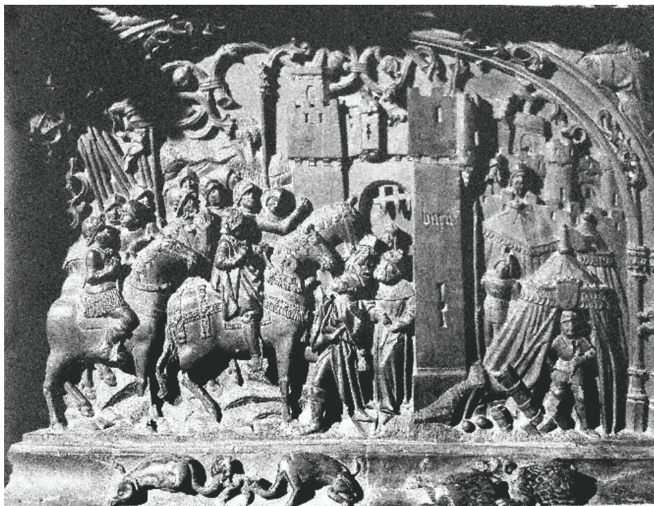
Fig. 1. Rodrigo Alemán. Toma de Baza. Sillería de coro de la catedral de Toledo.