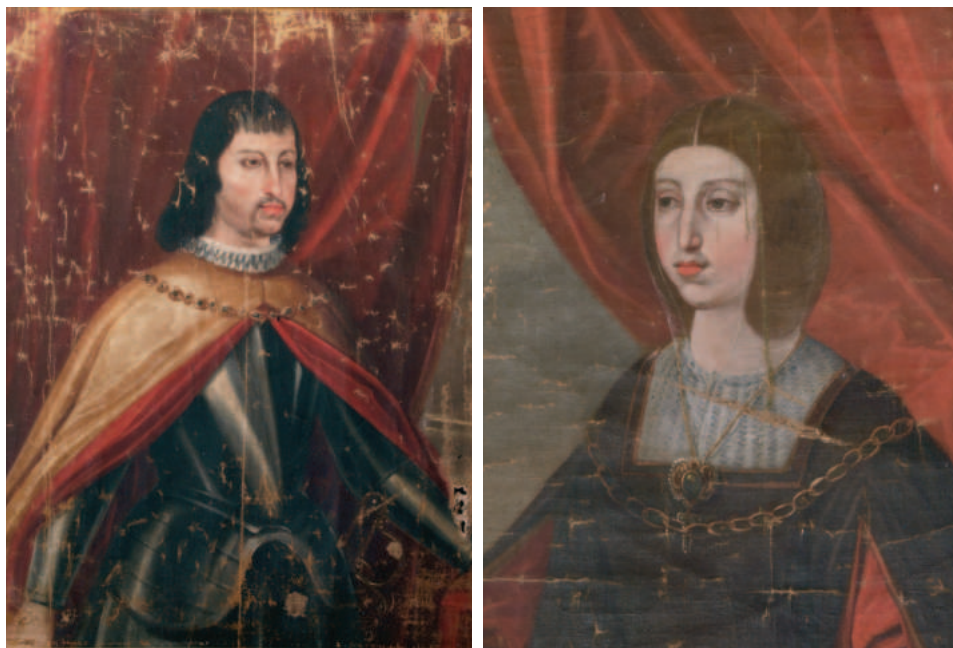
Fig. 2. Retratos de los Reyes Católicos. Iglesia Mayor de Baza.