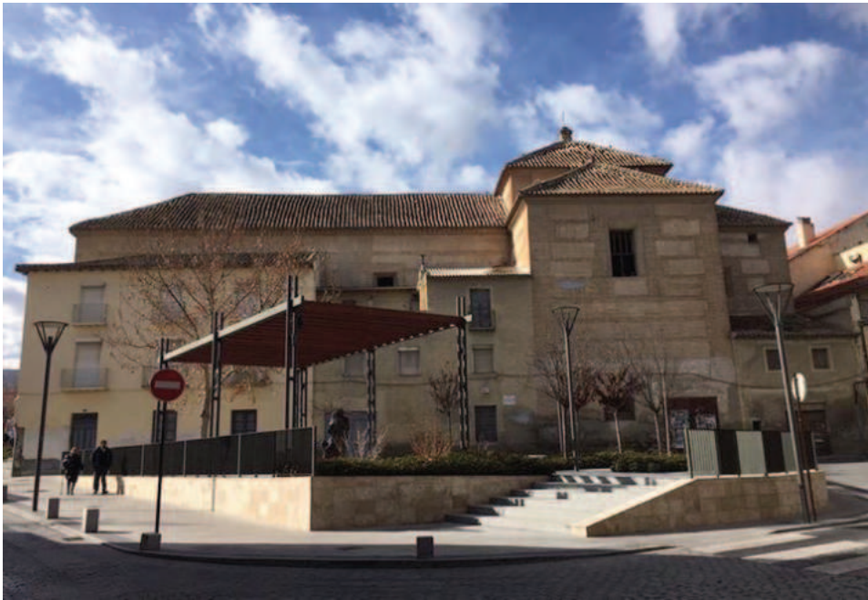
Fig. 10. Convento de San Antón de Baza.

bajo la advocación de san Antonio Abad y el patronazgo de Juana Enríquez de Silva que era hija del último Enríquez. Por consiguiente, el nuevo templo comenzó a construirse antes de acabar el siglo XVII y estaba concluido antes de 1733 (Segura & Valero, 2017).