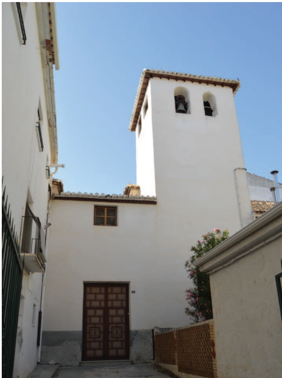
Fig. 11. Iglesia del antiguo convento de Santa Isabel de los Ángeles, de Baza.