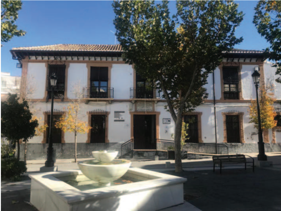
Fig. 8. Hospital de Santiago.

También se les donó una hilera de nueve casas en el mismo sitio y de esa forma el provincial de los dominicos en Andalucía accedió a que la orden se instalara en Baza: