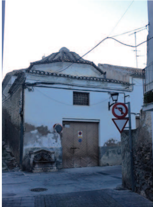
Fig. 13. Ermita del Santo Cristo del Humilladero.

En cuanto a los conventos que había en la ciudad de Baza, como hemos podido detallar anteriormente, había siete conventos de religiosos, uno de ellos de monjas, un beaterio del Orden Tercero de