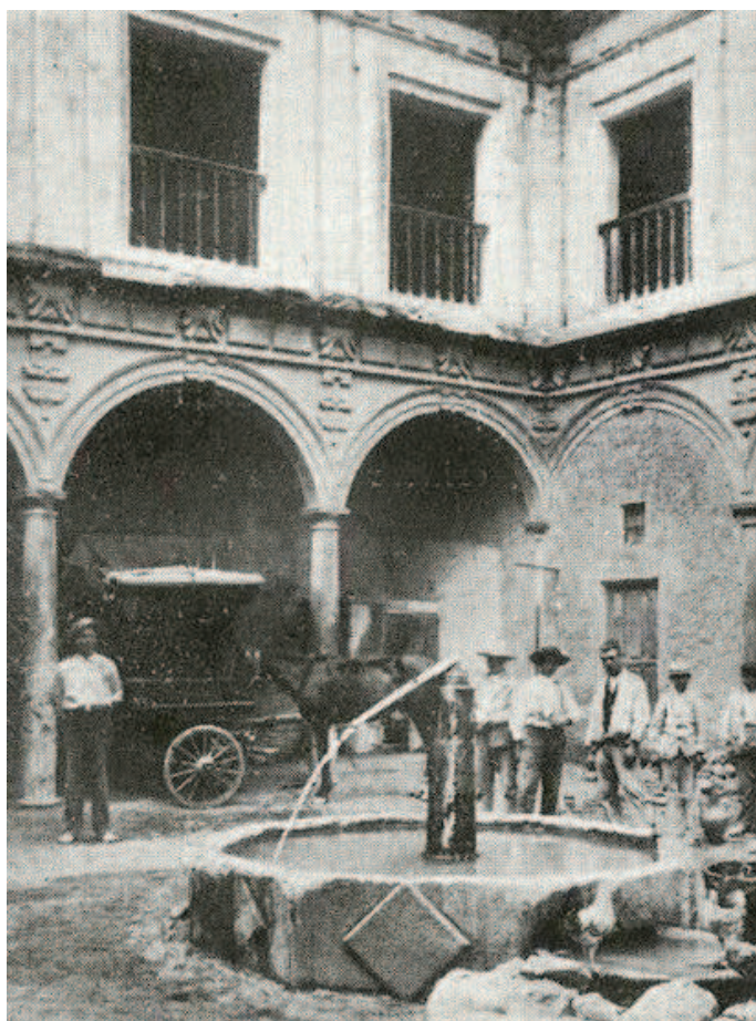
Fig. 5. Claustro del antiguo convento franciscano de Baza.