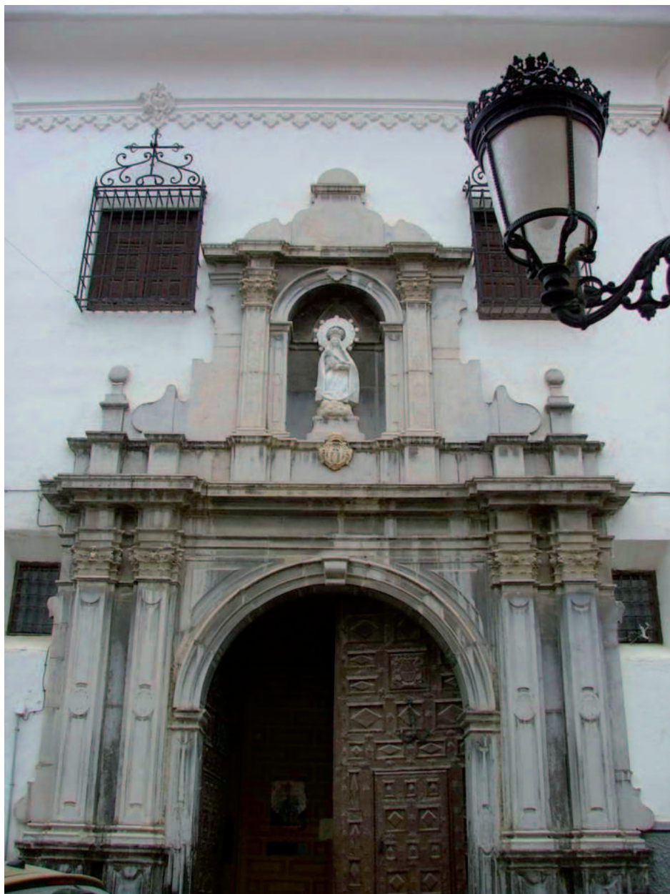
Fig. 7. Portada de la antigua iglesia de la Merced de Baza.