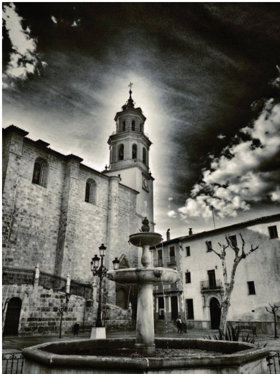
Fig. 4. Iglesia Mayor y antiguo Seminario de Baza.