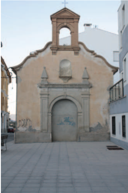
Fig. 12. Ermita de San Sebastián.

131-135), cuya custodia la tuvieron los padres jerónimos. Ermita de San Pedro Mártir, de San Felipe Neri, de San Leonardo Abad, de San Roque, de la Santísima Trinidad; la de San Nicolás del Moro y de San Agustín –sitas en la sierra de Baza–, la del Hospital 8 y la capilla santuario de María Magdalena.