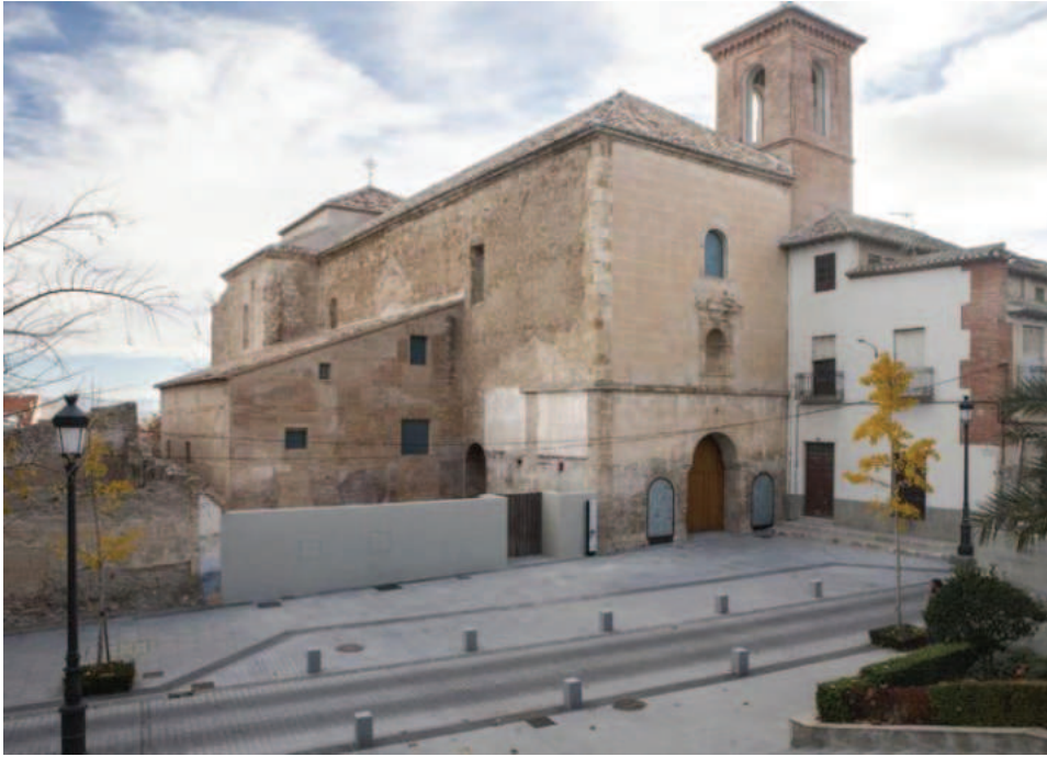
Fig. 6. Antiguo convento de frailes jerónimos de Baza.