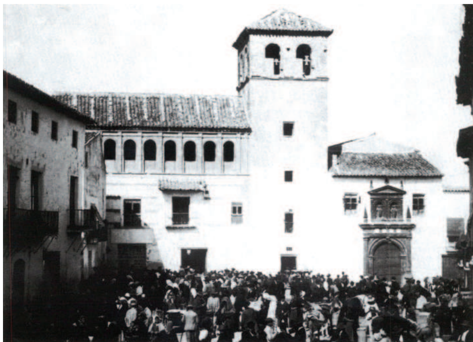
Fig. 9. Convento de frailes dominicos de Santa Bárbara de Baza.

Católicos” (Castillo, 2099: 118). Como buenos patronos, y a imitación de lo que hicieron previamente Enrique Enríquez y María de Luna, tuvieron reservado el derecho de enterramiento en la capilla mayor para ellos y su prole (Rodríguez, 2021).