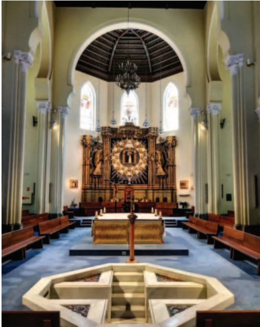
Fig. 6. Adecuación litúrgica de la iglesia de la Virgen de la Paloma (Madrid), por Antonio Ábalos y Kiko Argüello (1977).