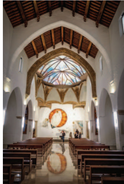
Fig. 7. Interior de la iglesia de San Nicolás (Granada), tras la intervención de Antonio Martín (2022).

El revisionismo artístico y el misoneísmo estético ha sido –y aun hoy es– una propuesta patrimonial que no únicamente han explorado los carismas de la Iglesia posconciliar. Lejos de ser así, el historicismo ha constituido un recurrente camino para quienes han pretendido reaccionar a los cánones visuales dominantes en el seno de la Iglesia, especialmente en aquellos casos en los que, la espiritualidad y constitución sociológica de tales vectores eclesiásticos, entronca con la tradición y las formas litúrgicas rubricistas. Nos referimos, particularmente, al caso del neobarroco formulado al abrigo de la piedad popular en el sur peninsular, especialmente en Andalucía, que ha abonado el arte sacro de una manera exponencial en las últimas cuatro décadas.