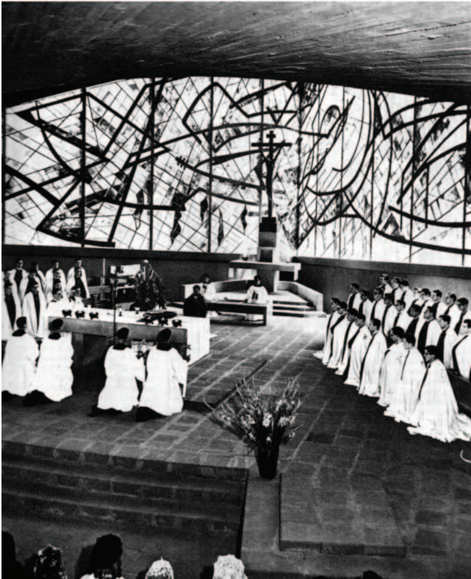
Fig. 3. Solemnidad litúrgica en la capilla del Altillo (Coyoacán, Ciudad de México).