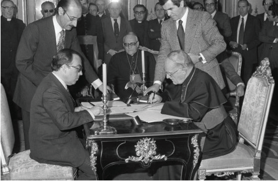
Fig. 1. Firma del acuerdo entre España y la Santa Sede (1979).

refleja su enorme complejidad, la difícil interpretación de los términos y los intereses cruzados que existen en torno a los bienes que componen la gran masa patrimonial de la Iglesia.