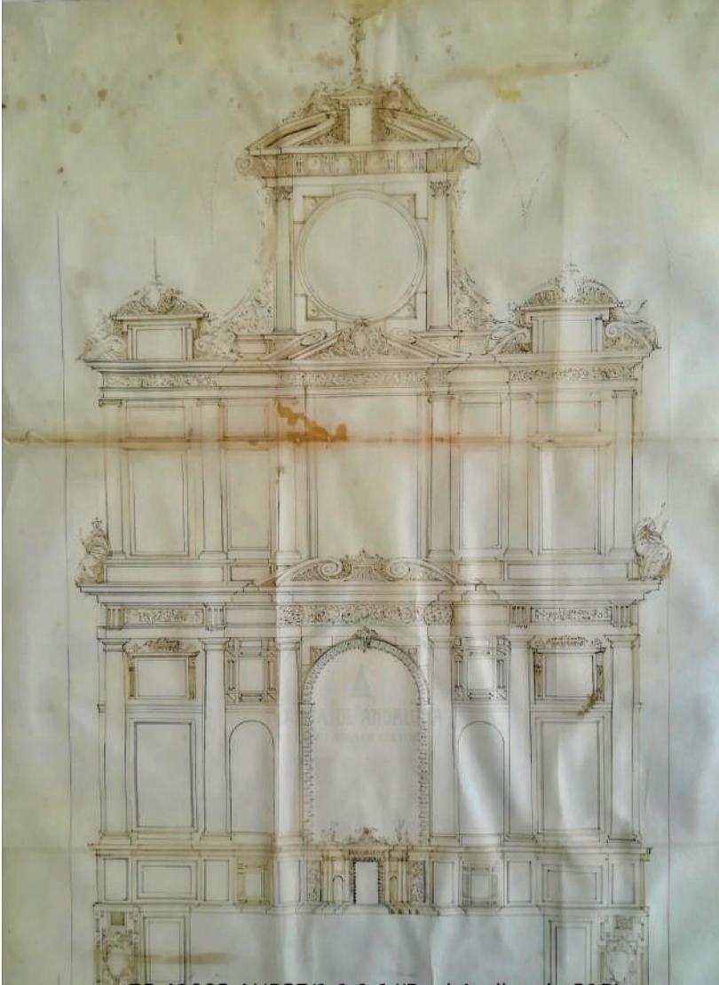
Lám. 2. Trazas del retablo mayor del convento de Santa María de Gracia (c. 1585-1593).

En resumen, salvo error u omisión, en el siglo XVI, desde 1525 hasta 1599 (74 años) entraron en el monasterio 185 mujeres (2,5 por año) entre niñas, adolescentes, adultas y viudas.