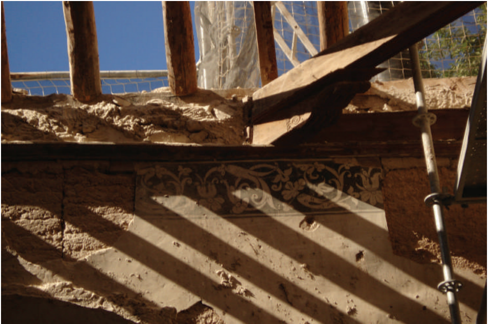
Lám. 3. Estado de la antigua capilla de Nuestra Señora del Rosario durante las obras de restauración. Se aprecian restos de decoración del siglo XVII y parte de la estructura de tirantes de la armadura mudéjar de madera, que fue bárbaramente desmontada y trasladada al Hotel Málaga Palacio. Fotografía tomada por el autor el 3 de julio de 2009.

las circunstancias de su fundación, pero lo más probable es que se realizase tomando como imagen titular una ya existente en el convento, como ocurriría en el año 1632 en ese mismo templo al fundarse la Hermandad de San José, cuya imagen titular ya estaba allí desde al menos junio de 1621 57 y había sido realizada por una orden testamentaria de 1609 (Laguna, 2005).