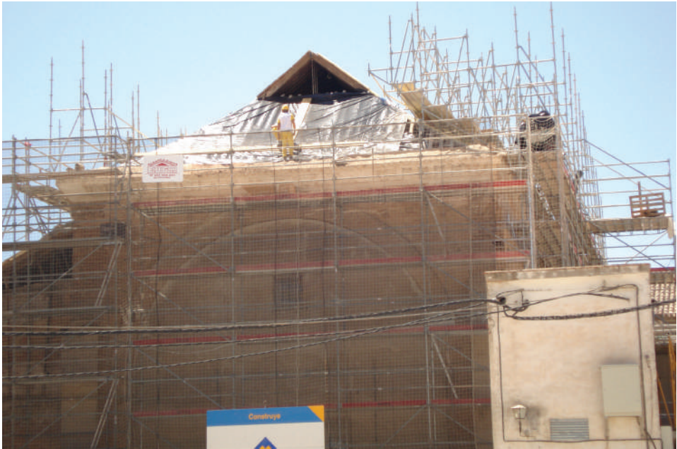
Lám. 2. Imagen de las obras de colocación de cubiertas en la antigua iglesia del convento de Santo Domingo de Huéscar.

Por último, sabemos que la portada de piedra que enmarca la entrada principal a la iglesia del convento fue finalizada en el año 1605, gracias a que el cantero que talló la clave del dintel dejó en ella grabada la fecha, que es perfectamente visible desde el suelo.